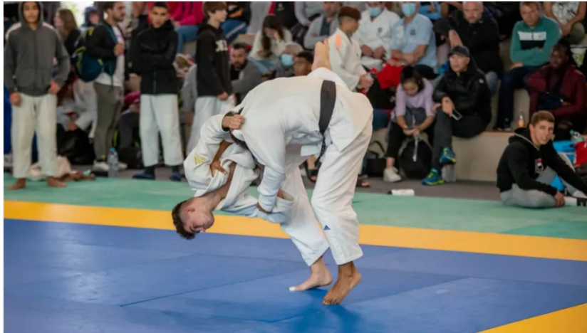
Le tournoi national cadets et cadettes du JC du Bocage est devenu une référence.