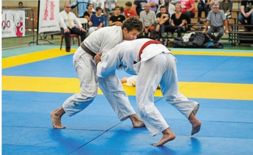
Bressuire, salle Métayer, hier. Les combats, qui ont parfois été serrés, ont séduit le public.

450 cadets et cadettes ont participé au tournoi national hier à Bressuire.